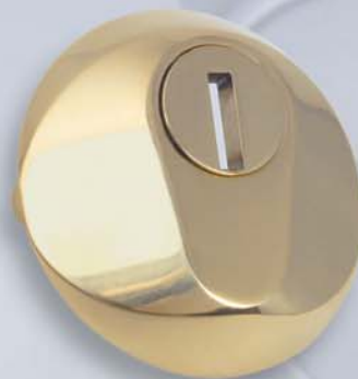
Tenax tondo (interasse fori 38 mm)