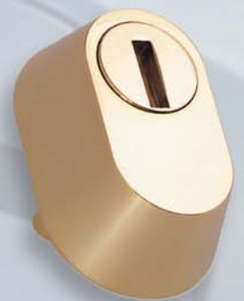
Tenax ovale (interasse fori 20 mm)

NB. Il Tenax é compatibile con cilindri SCUDO AGB Per altre informazioni contattare l'Alban Giacomo Spa